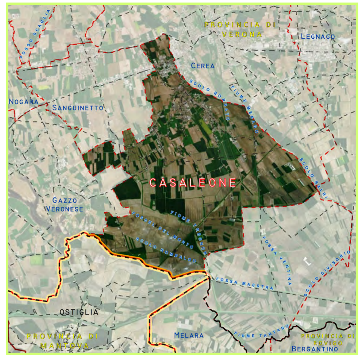
TAVOLA 2.1 - RISCHIO IDRAULICO PIANO GESTIONE RISCHIO ALLUVIONI (ADBPO)