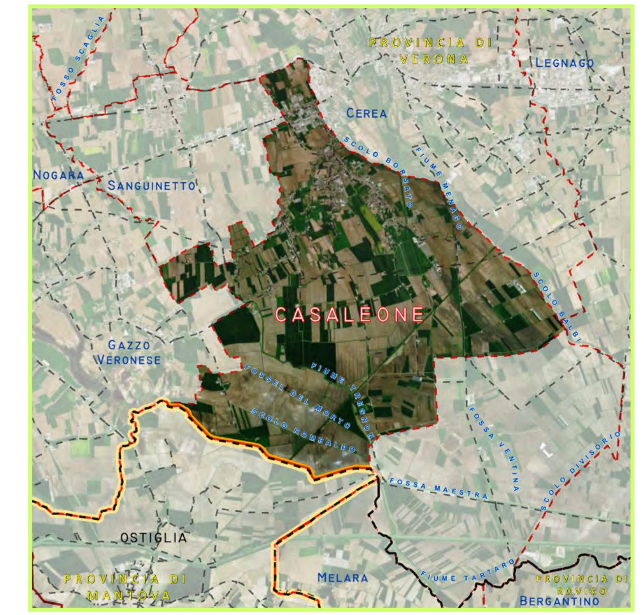
TAVOLA 2.2 RISCHI IDROGEOLOGICI